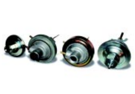
foto 11 Er waren vier verschillende typen vacuüm diafragmahuisen. Van links naar rechts, een enkel diafragmahuis voor '65-'67 en '68-'70 FE automaat, een dubbel diafragmahuis met een zinkplated ring voor 302-2V, '67-'70 FE automaat en 351 automaat, een dubbel diafragmahuis met een cadmium-plated brede ring voor Boss motoren, '70 428 CJ handgeschakeld en '70-'71 429 CJ handgeschakeld, een dubbel diafragmahuis voor een '72-'73.