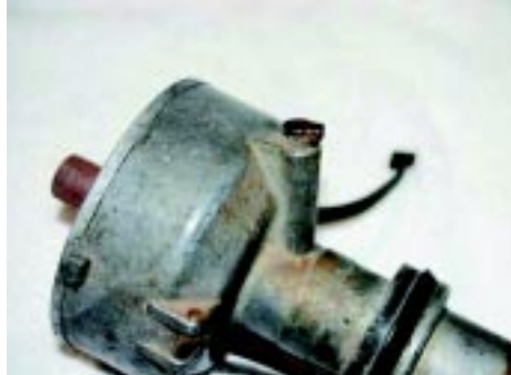
foto 5 Een '64 1/2 verdeler gemakkelijk te herkennen aan het oliegat met klepje om de verdeleras te smeren.