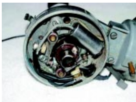
foto 8 Een Boss 429 verdeler met een dubbele set contactpuntjes.