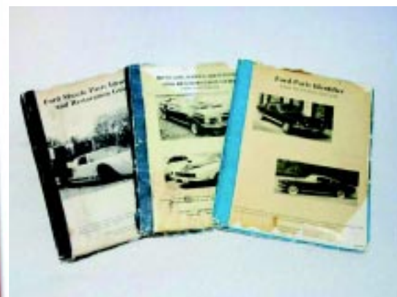
foto 2 en 3 De High Performance Ford Engine Parts Interchange van CarTech met 500 verschillende nummers voor '64 1/2-'73 Mustang verdelers. De Ford Parts Identifier boeken nog steeds nieuw verkrijgbaar op www.blueovalnews.com .