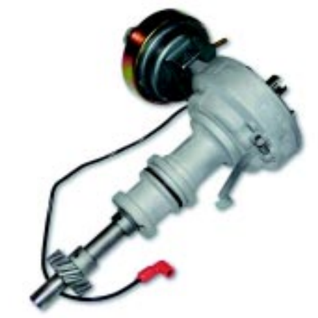
foto 14 Een 1971 Boss 351 is zeer zeldzaam.

Met dank aan Mustang Monthly voor het gebruik van de foto's.