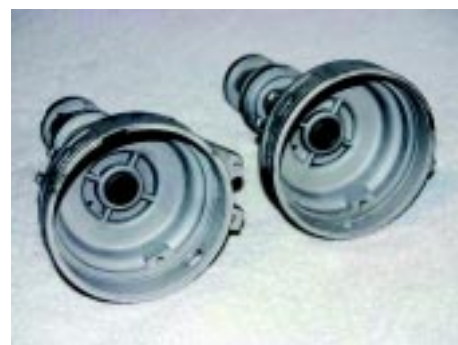
foto 9 Links een Boss 302 verdeler die vacuüm vervroeging gebruikte. Dit zie je aan de twee oortjes waar het diafragmahuis aan werd gemonteerd. De 289 Hi-Po verdeler rechts had centrifugale vervroeging.