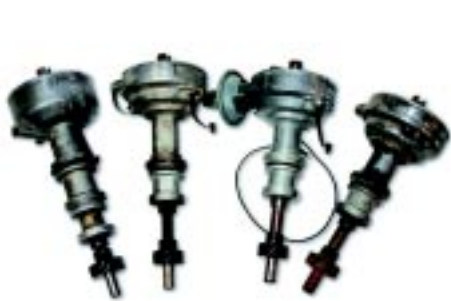
foto 4 Van links naar rechts, '64 1/2 FoMoCo met oliedop - dit is een verdeler voor een 427, '65-vroeg '67 FoMoCo, late '67-'71 Autolite en een '72-'73 Motorcraft.