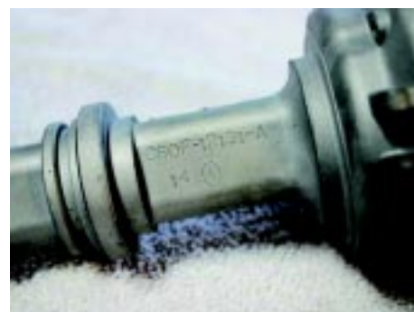
foto 12 Een Boss 302 verdeler met code C80F-12131-A op de zijkant van de schacht.