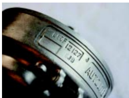
foto 13 Een Autolite verdeler met code C80F-12127-J voor een 1969 Cobra Jet automaat, gemaakt op 9 september 1968, code 8J9.