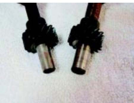
foto 7 Links de dunne as van de 289/302 en FE big block en rechts de dikke as van de 351W, 351C en 429.