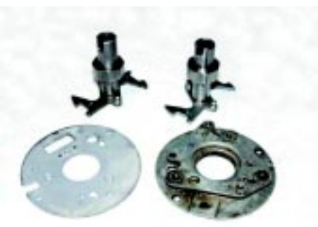
foto 10 Basisplaten en assen verschillen van elkaar in Mustang verdelers. Links een plaat van een 289 Hi-Po verdeler voor een dubbele set contactpuntjes en centrifugale vervroeging en rechts een plaat van een Boss 302 verdeler voor een dubbele set contactpuntjes en vacuüm vervroeging. Let op de langere as.