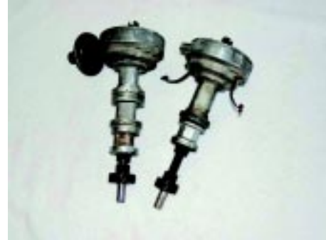
foto 6 Links een FE big block verdeler met drie ringen en rechts de small block/429 verdeler met twee ringen.