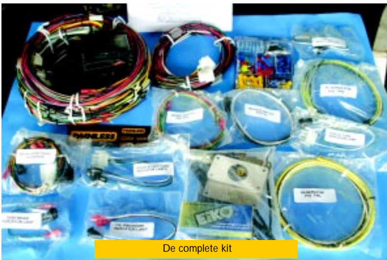
De complete kit